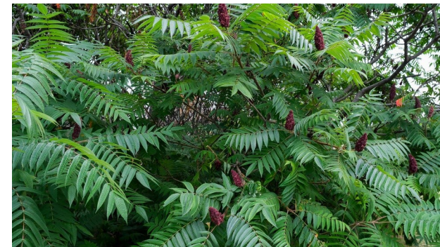
Sureau du Canada