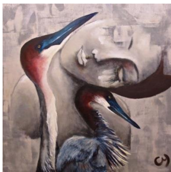
Artiste : Christyne Proulx